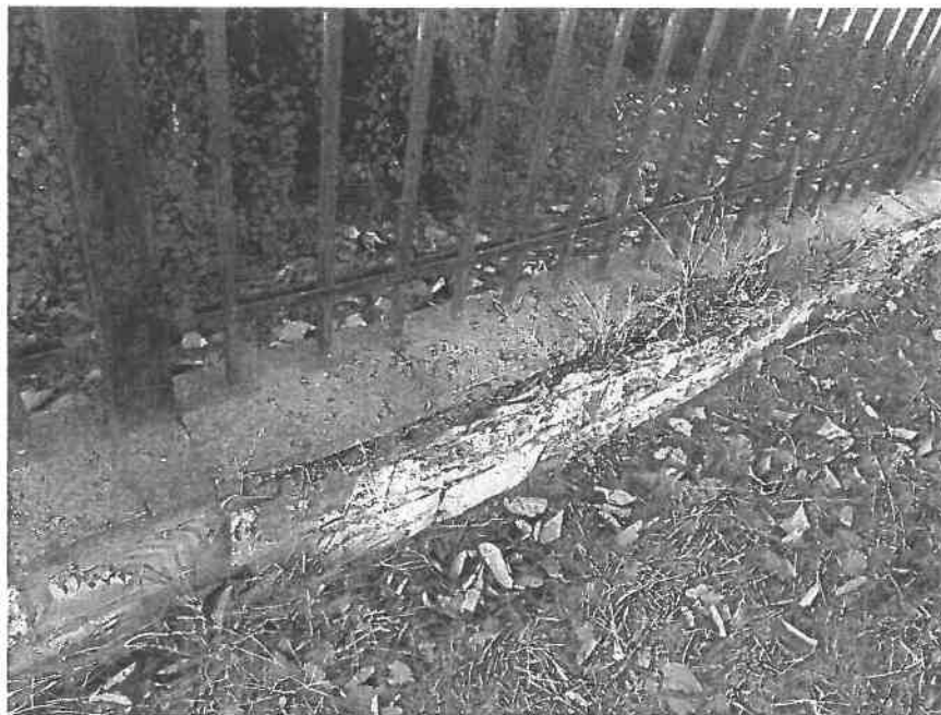
Soclu gard incintă – defecte de exploatare

- pavimentul realizat din pavele gri și roz atât din interiorul cimitirului cât și în zona de alee de acces care face legătura între strada principală și cimitir nu este plan; pavimentul este tasat diferențiat și se prezintă vegetație crescută prin rosturile aleii pietonale. În proporție de 20%, pavelele sunt degradate (rupte, crăpate); cauza principală a degradărilor și stării tehnice a pavimentului este alcătuirea stratului suport din nisip, lipsa unei compactări corespunzătoare și infiltrațiile cauzate de ape meteorice în timp;