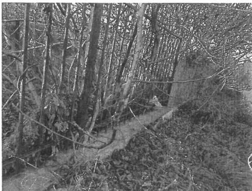
Vegetație uscată în interiorul incintei

- aspectul vizibil general este nepotrivit unei opere comemorative de război: perimetral sunt depozitate resturi vegetale, materiale de construcție abandonate, vegetație crescută necontrolat, fapt care a afectat elementele de construcție ale împrejurimii și a amplasamentului în ansamblu;