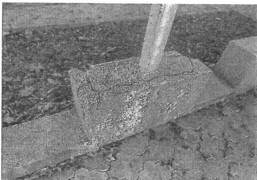
Însemne de căpătâi – defecte de exploatare

- bazele însemnelor de căpătâi prezintă degradări în proporție de 30%; degradările constau în exfolieri ale finisajelor și degradări ale betonului;