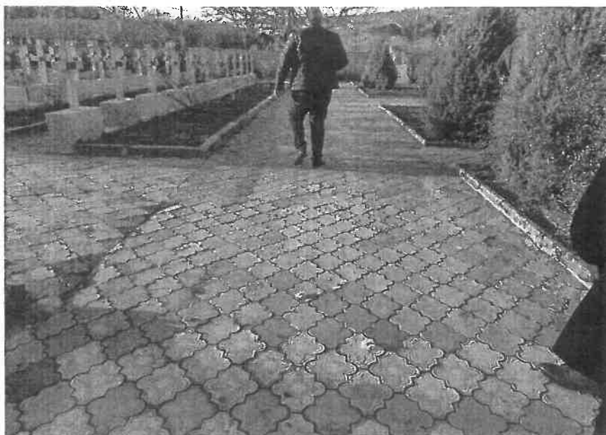
Paviment alei pietonale

- pavimentul realizat din pavele gri și roz atât din interiorul cimitirului cât și în zona de alee de acces care face legătura între strada principală și cimitir nu este plan; pavimentul este tasat diferențiat și se prezintă vegetație crescută prin rosturile aleii pietonale. În proporție de 20%, pavelele sunt degradate (rupte, crăpate); cauza principală a degradărilor și stării tehnice a pavimentului este alcătuirea stratului suport din nisip, lipsa unei compactări corespunzătoare și infiltrațiile cauzate de ape meteorice în timp;