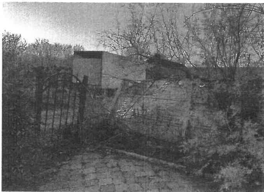
Panou de gard degradat

- pe latura perpendiculară a împrejuririi (latura stângă a terenului privind dinspre strada principală) există o poartă metalică pietonală ce prezintă urme de coroziune avansată;