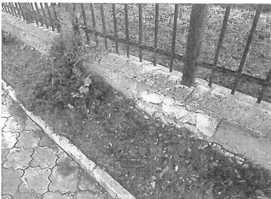
Soclu gard incintă – defecte de exploatare

- împrejmuirea de la strada principală, alcătuită din soclu placat cu elemente prefabricate, panouri de gard metalic și poartă auto în 2 canate prezintă defecte de exploatare semnificative, astfel: suprafața de placare strat finisaj la soclu degradat în proporție de 50%, elemente decorative parțial căzute, dizlocate de la poziție, cauza principală fiind creșterea necontrolată a vegetației;