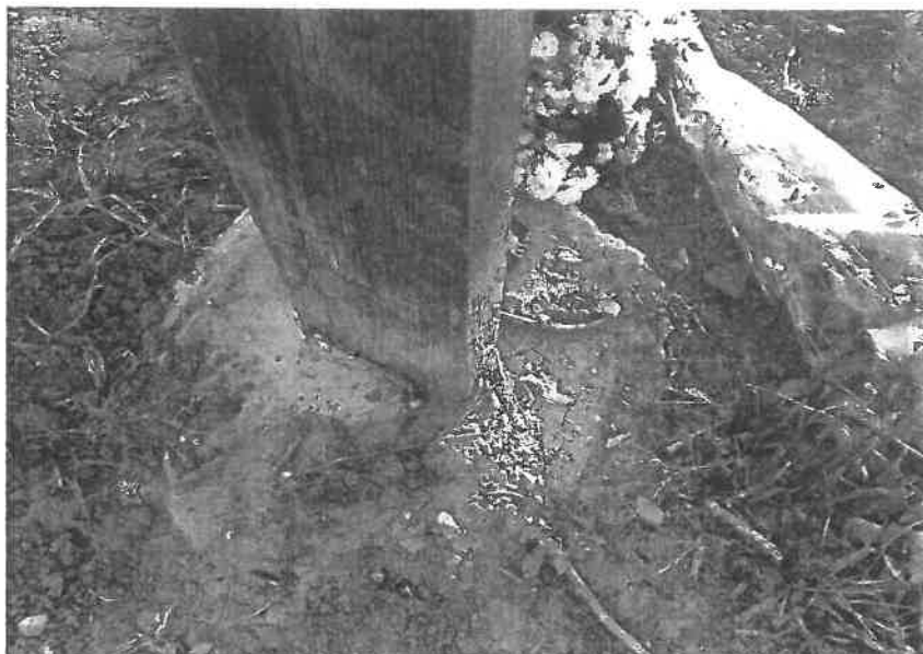
Troiță de lemn – defecte de exploatare

Degradarea avansată a elementelor componente reprezentative din cadrul necropolei de război poate determina dispariția simbolurilor jertfei eroilor români.